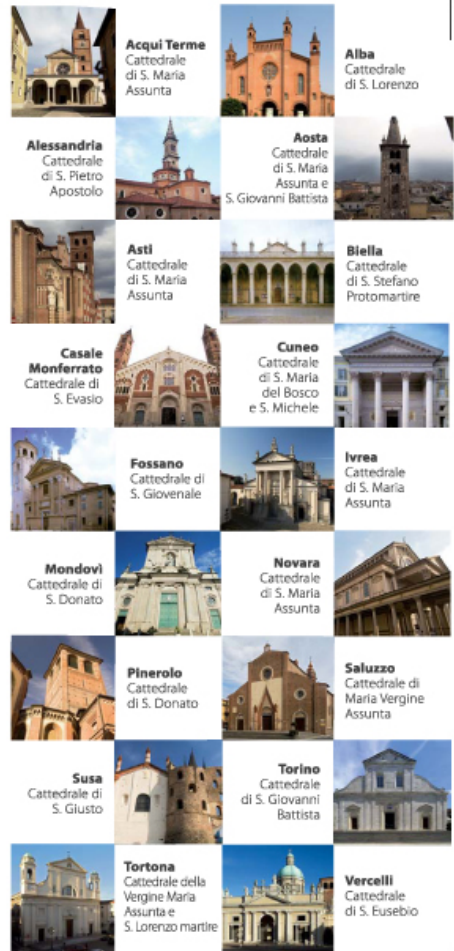
Acqui Terme Cattedrale di S. Maria Assunta